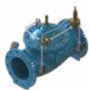
Basınç Tahliye Vanası 63

Fiyatlarımıza KDV dahil değildir. Döviz kuru; fatura tarihindeki T.C.M.B. efektif satış kurundan hesaplanacaktır.