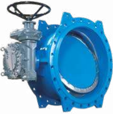
■ Çift Flanşlı Kelebek Vana