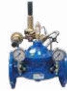
Basınç Düşürücü Kontrol Vanası 62