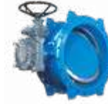
Çift Flanşlı Kelebek Vana 60