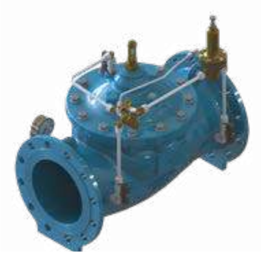
■ M3200 Basınç Tahliye Vanası