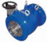
İğne Vana 61