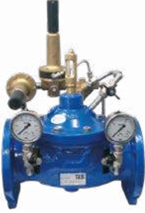
■ M3100 Basınç Düşürücü Kontrol Vanası